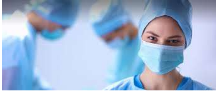
دانشنامه سرگیجه و اختلالات پزشکی زمینه ساز سرگیجه